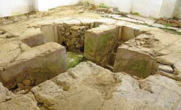
Baptistério da Basílica Paleocristã - (Villa Romana de Torre de Palma)