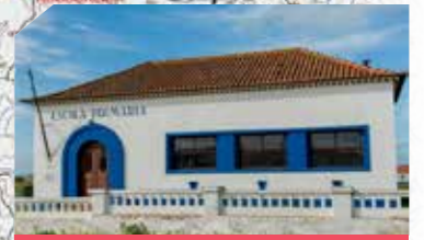
Vale de Rocins

Pequeno aglomerado urbano com dimensão maior do que um monte onde residem cerca de 40 habitantes. Tem uma escola primária desativada, uma mercearia e uma taberna. A fama deste lugar provém do delicioso pão cozido no forno de lenha comunitário da aldeia onde ainda hoje se coze pão, uma ou duas vezes por semana.