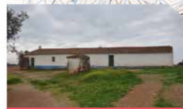
Monte da Malhadinha Velha