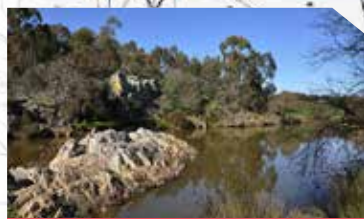
Pego da Moira Linda

Uma represa na ribeira de Terges, com um espelho de água e enquadramento paisagístico surpreendentes. Um local refrescante que convida a uma paragem para repouso e merenda.