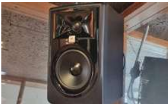
Figura 11 - Colunas JBL