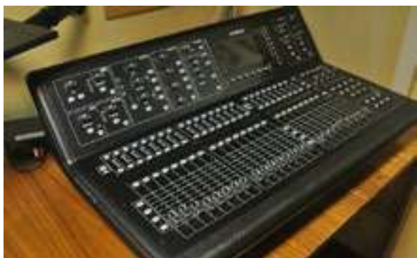
Figura 8 - Mesa mistura digital