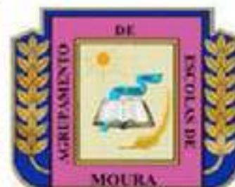
Agrupamento de Escolas de Moura