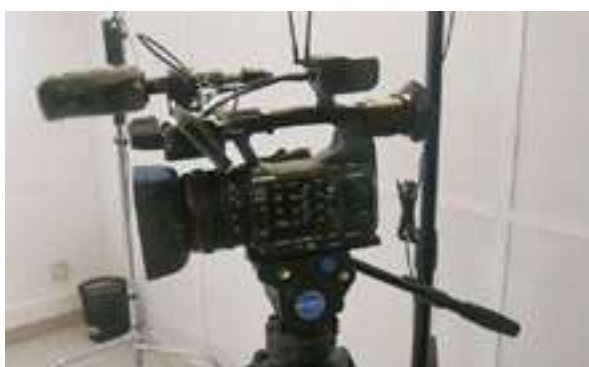
Figura 3 - Câmara