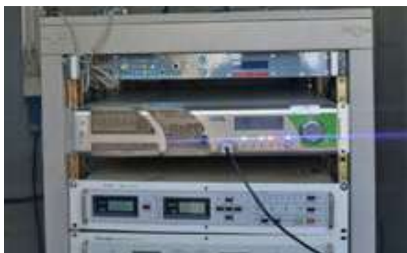
Figura 22 - Emissor