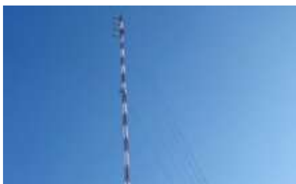
Figura 24 - Antena