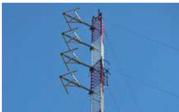
Figura 23 - Estrutura Radiante