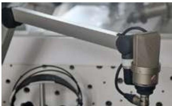
Figura 20 - Microfone