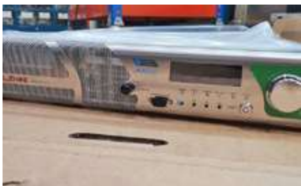
Figura 13 - Emissor