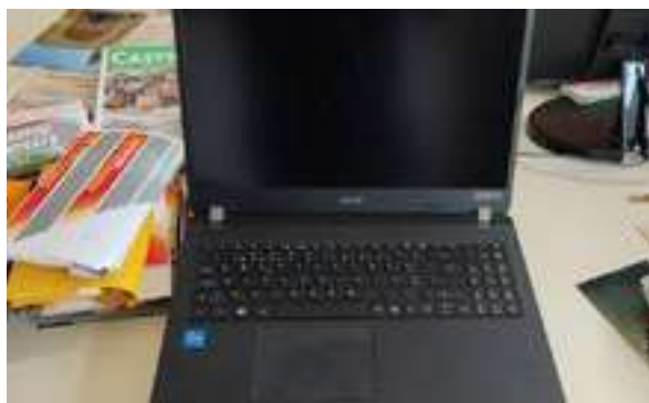
Figura 12 - Computador