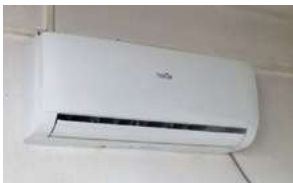
Figura 18 - Ar Condicionado