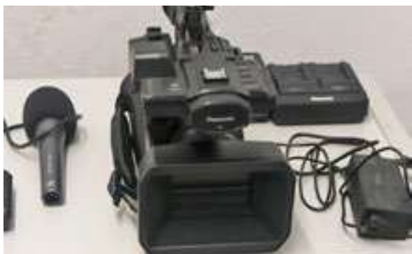
Figura 15 - Câmara de vídeo