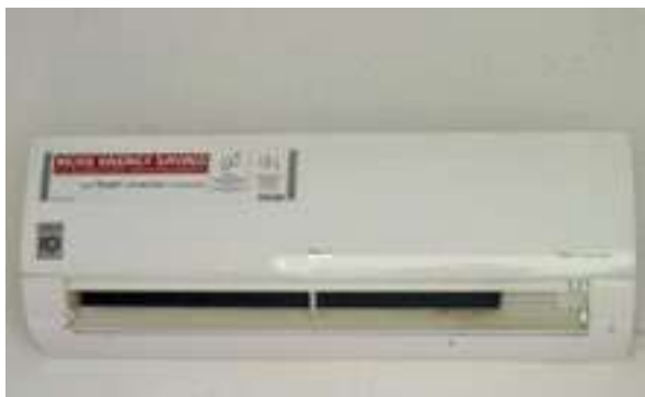
Figura 1 - Ar condicionado