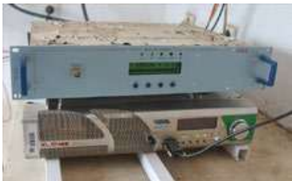
Figura 5 - Emissor 1 Kw